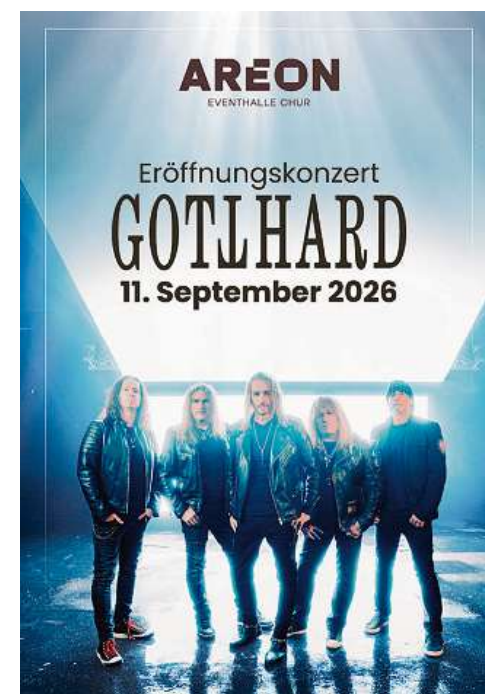
Eröffnungskonzert Gotthard am 11. September 2026 in der neuen Eventhalle AREON in Chur.