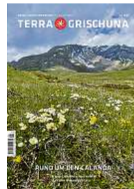
5/23 Rund um den Calanda