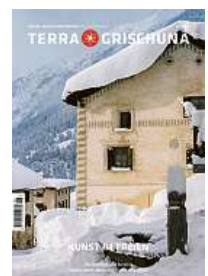
6/25 Kunst im Freien