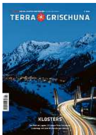
1/22 Klosters (vergriffen)