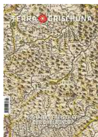
2/24 500 Jahre Freistaat der Drei Bünde