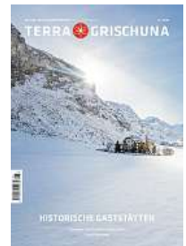
6/23 Historische Gaststätten