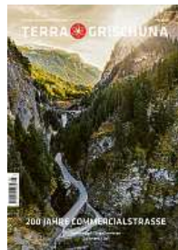
3/23 200 Jahre Commercialstrasse