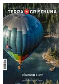
5/25 Bündner Luft