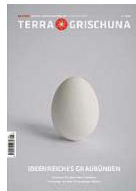
5/22 Ideenreiches Graubünden