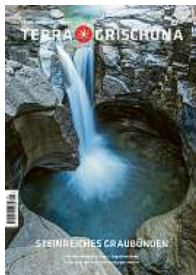
1/23 Steinreiches Graubünden