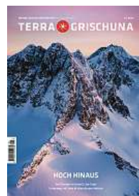
5/24 Hoch hinaus