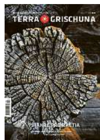
4/24 75 Jahre Pro Raetia