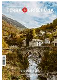
2/23 Die Südtäler