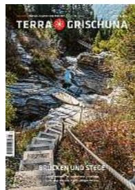
3/22 Brücken und Stege