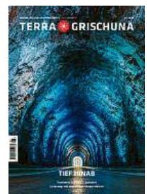
6/24 Tief hinab