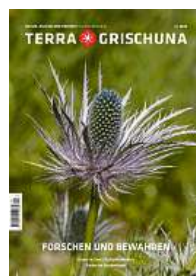
4/25 Forschen und bewahren