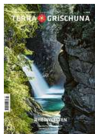
3/24 Rheinwelten (vergriffen)