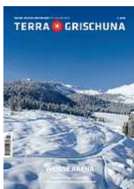
1/25 Weisse Arena