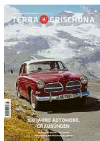
3/25 100 Jahre Automobil Graubünden (vergriffen)