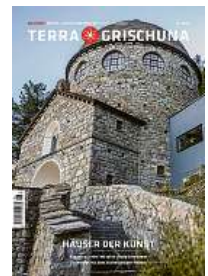
6/22 Häuser der Kunst