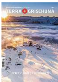
1/24 Ferienland Graubünden