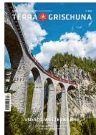
4/23 UNESCO-Welterbe RhB (vergriffen)