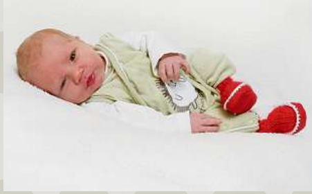
Mailo Cumbel 5. Dezember 2024